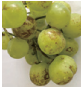
アザミウマ被害果

カキ：落葉病、炭疽病、カキノヘタムシガ等 モモ：灰星病、黒星病、シンクイムシ類等