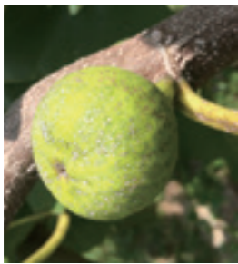
イチジクそうか病被害果